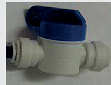
Regolatore flusso bianco azzurro