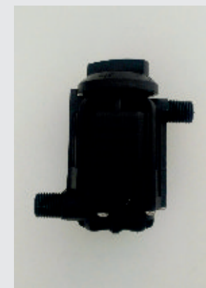
Conta litri- mod. blocco