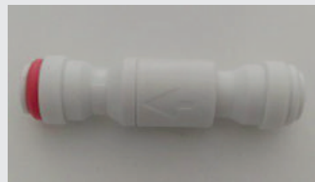
Valvola non ritorno